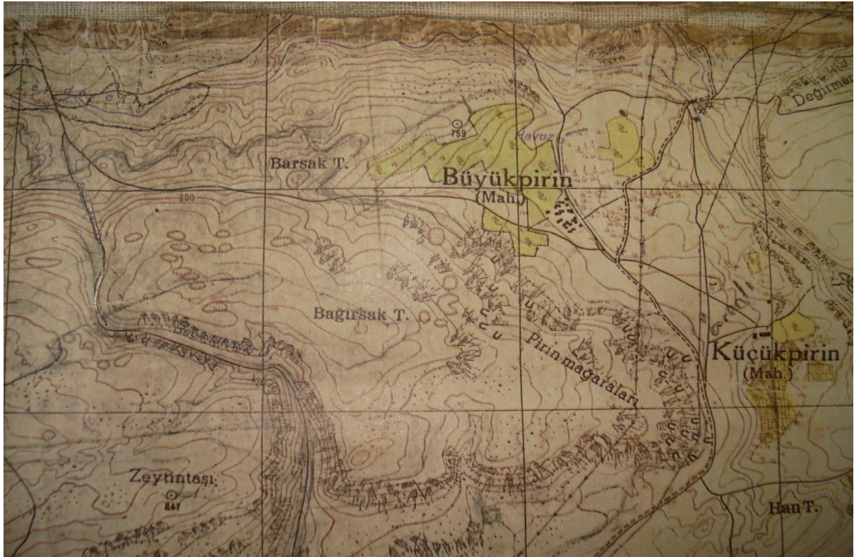
Şekil 1. Araştırma sahasının topografik haritası

Araştırma bölgesinin jeolojisi ile ilgili bilgiler, M.T.A. Enstitüsüne ait ilgili jeoloji raporları ile kaynak ve literatürlerden yararlanılarak hazırlanmıştır. Araştırma bölgesindeki bitki birliklerini karakterize edebilecek yerlerden toprak örnekleri alınmış, alınan bu toprak örnekleri Başbakanlık Köy Hizmetleri Genel Müdürlüğü Adıyaman Köy Hizmetleri Araştırma Enstitüsü'nün Toprak Laboratuvarında analiz ettirilmiştir.