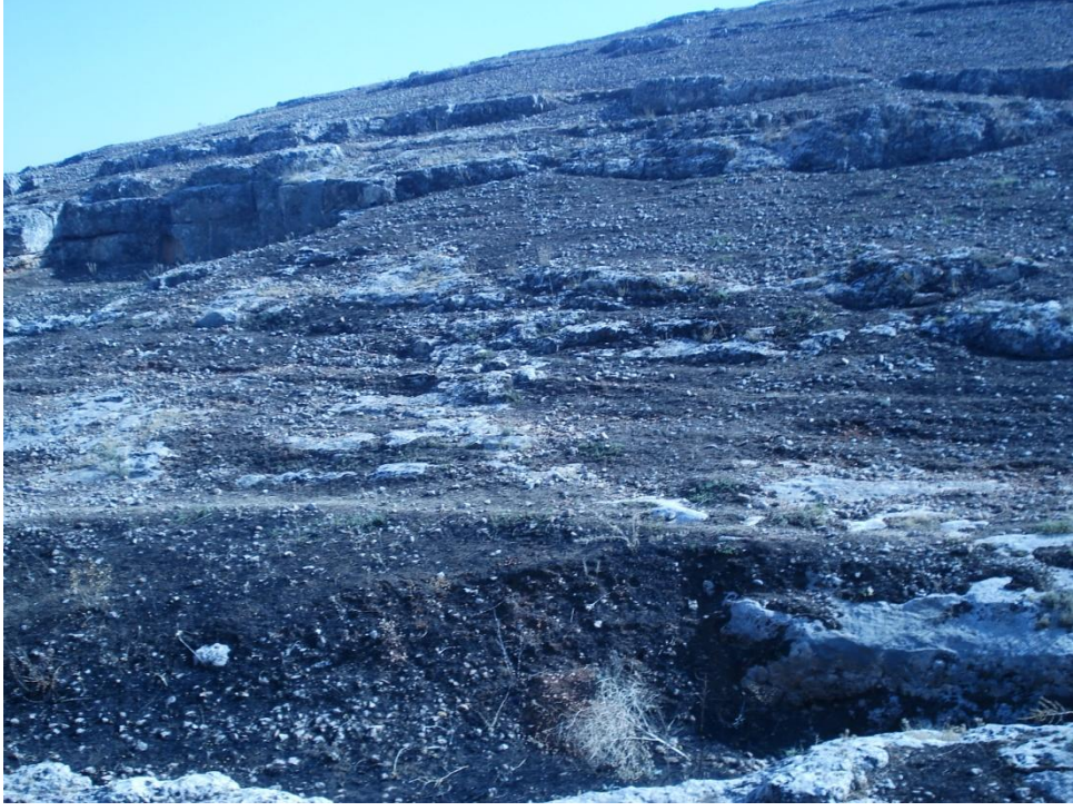
Resim 3. Nedensiz insan tahribi (ateşe verme)