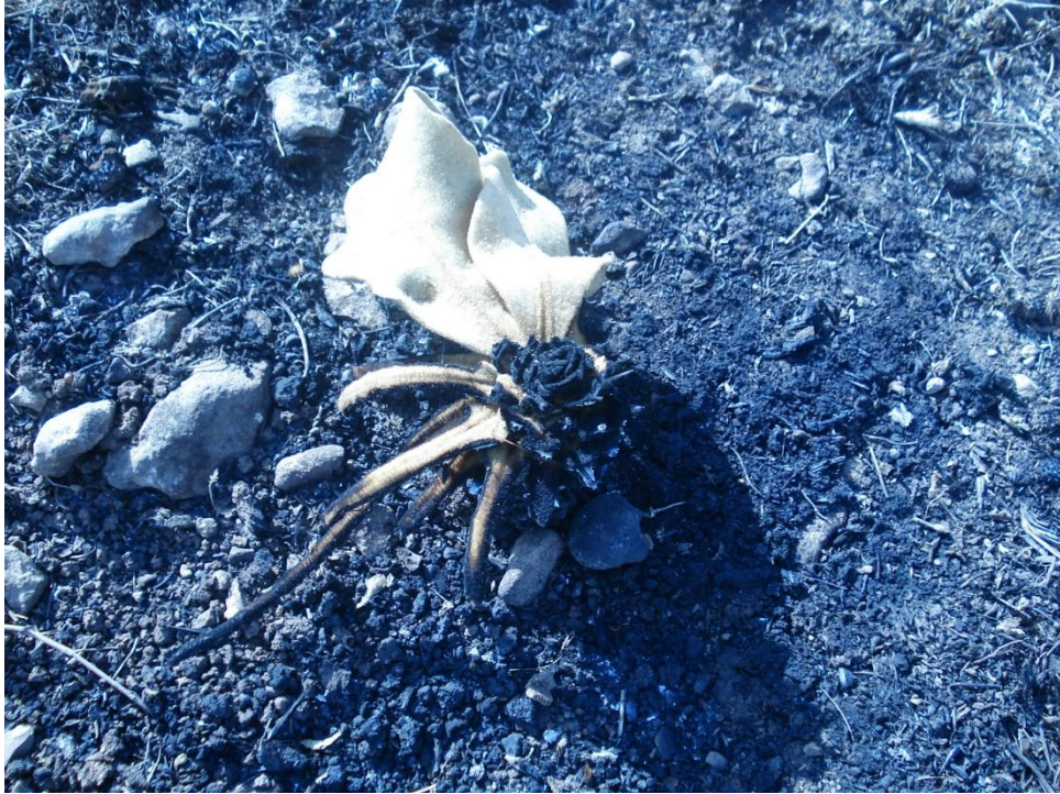
Resim 2. Hayvandan kurtulan insana yakalanıyor