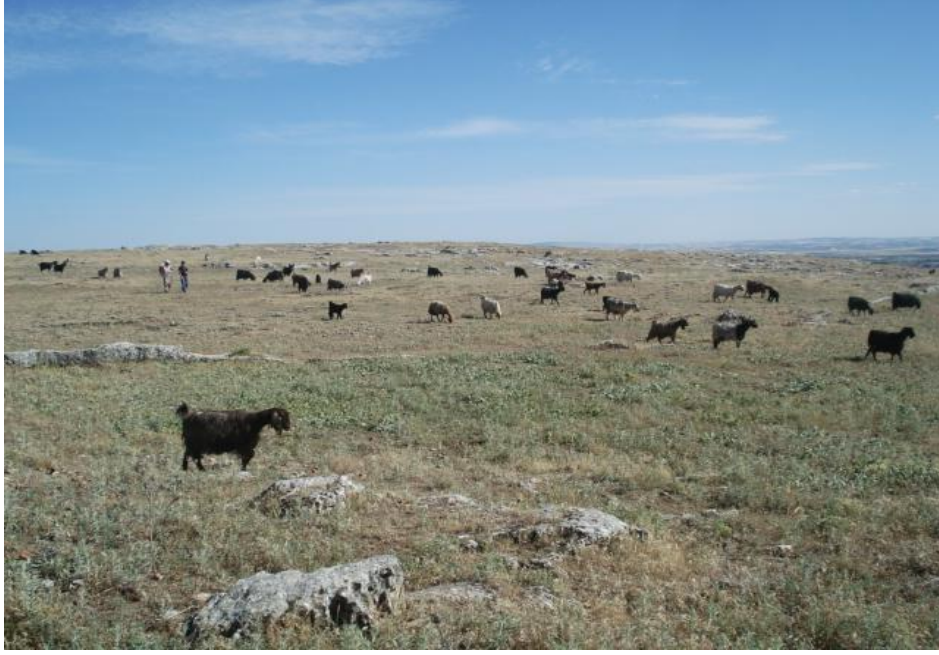
Resim 1. Aşırı biyotik baskıya örnek