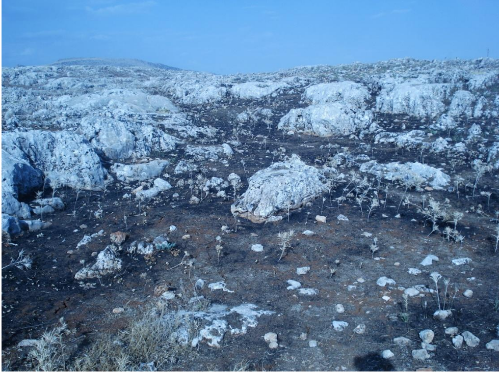
Resim 4. Tamamen keyfi yakım