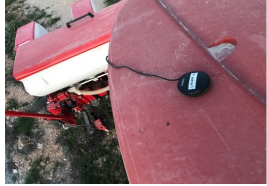
Şekil 5. GPS alıcısı