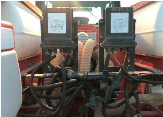
Şekil 3. elektrik motorun kontrol ünitesi