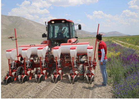
Şekil 7. tarlada pnömomatik tek dane ekim makinasıyla ekim işlemi

yapılmıştır. (Şekil 8). Bu ölçümlerle mısır tohumunun KETA (kabul edilebilir tohum aralığı % oranı), İO (ikizlenme % oranı), BO (boşluk % oranı) ile varyasyon katsayısı % oranı belirlenmiştir. Tohumlar filizlendikten sonra bitkiler arası mesafeler ölçülerek tarla çıkış derecesi belirlenmiştir.