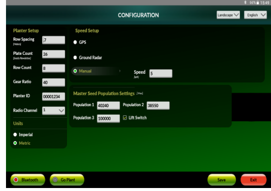
Şekil 4. kontrol monitörü