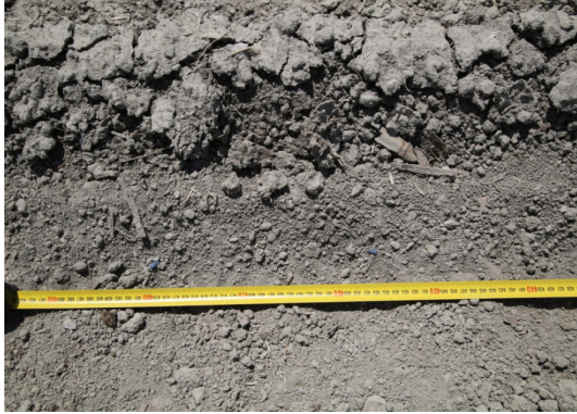
Şekil 8. tarlada ekimi yapılan tohumları sıra üzeri aralıklarının ölçülmesi

Ölçümlerden elde edilen veriler aşağıda formüllerle ortalama, varyans, standart sapma ve varyasyon katsayıları hesaplanmıştır. [18, 19]