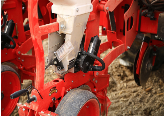
Şekil 2. Pnömatik tek dane ekim makinasındaki ekici düzeni hareket ettiren elektrikli motor