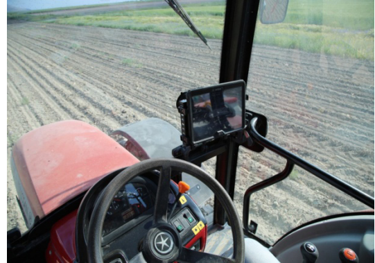
Şekil 6. kabinde yer alan tablet ve arayüz ekranı

Laboratuvar da yapışkan bant denemelerinde hareketini elektrikli motordan alan pnömatik tek dane ekim mibzeri ile hareketini tahrik tekerleğinden alan pnömatik tek dane mibzeriyle 1,67 m/s hızda ve 150 mm mesafede mısır tohumları 3 tekrarlı, ayçiçek tohumları ise 250 mm mesafede 2'şer tekrarlı olarak ekim denemesi yapılmıştır.