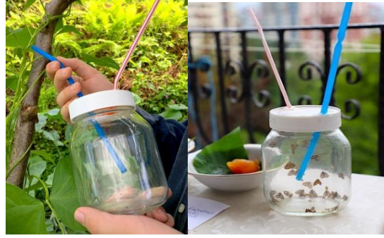
Şekil 6. Böcek toplayıcı

Bir kavanoz ve iki pipet kullanılarak böcek toplama aparatı yapıldı (Şekil 6). Aparat pipetlerinden geniş olanın ucu böceklerin geçebileceđi kadar açık bırakılarak, diđer ucu nefes ile yutulma riski olmaması için kumaŐ kaplanmıŐtır. Nimf ve ergin bireyler tarlada bulunan fasulye, salatalık ve biber gibi bahçe bitkileri üzerinden böcek toplayıcı aparat yardımıyla toplandı.