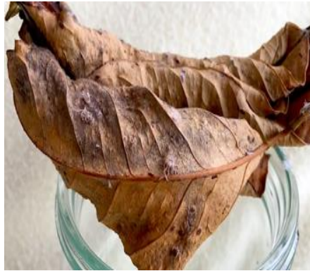
Şekil 1. Yumurta bırakılmış kuru yaprak

Ricania simulans , bitkiler üzerinden beslenen ve çođalan, bunu yaparken bitkiye zarar veren bir çekirge türüdür. Son yıllarda verdiđi zarar ve yayılım hızından dolayı özellikle Karadeniz Bölgesi’nde istilacı bir tür halini almıştır. Yumurtlamak için bitkilerin kuruyan dallarını kullanarak (Şekil 1), bu dallara ve yumurtadan çıkınca üzerlerinden beslenerek diđer dal ve bitkilere zarar vermektedir (Şekil 2). Bu türün beslenmek için çay ve üzüm gibi bazı tarımsal bitkileri tercih ettiđi gözlemlenmiştir [1].