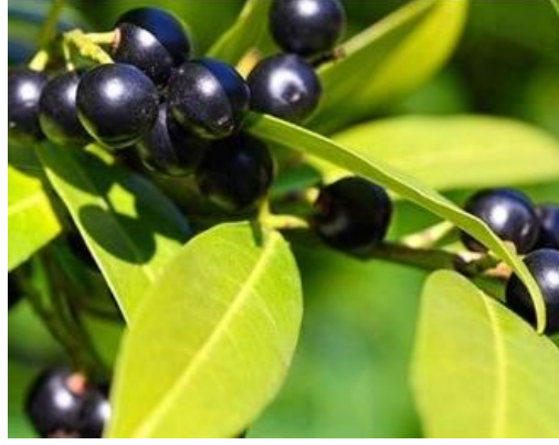
Şekil 4. Karayemiş yaprak ve meyvesi

Karayemiş (Şekil 4); Karadeniz Bölgesi'nde yetişen, fenolik maddeler ve C vitamini açısından zengin bir meyvedir [10]. "Karayemiş Spermatoptyta bölümü, Angiospermaea alt bölümü, Magnoliatae (Dicotyledones) sınıfı, Rosaceae familyası Prunoideae alt familyası Laurocerasus duhamel . cinsine ait bir türdür. Bu türün Latince adı L. officinalis Roemer veya Prunus laurocerasus (L.) Mill. dir." [19]. Karayemişin ülkemizde bu adın dışında kullanılan yaygın ismi taflandır. Bitkinin dünya üzerinde Karadeniz'in doğu bölgeleri, Kafkaslar, Toroslar, Kuzey ve Dođu Marmara'da doğal olarak yetişmektedir [14].