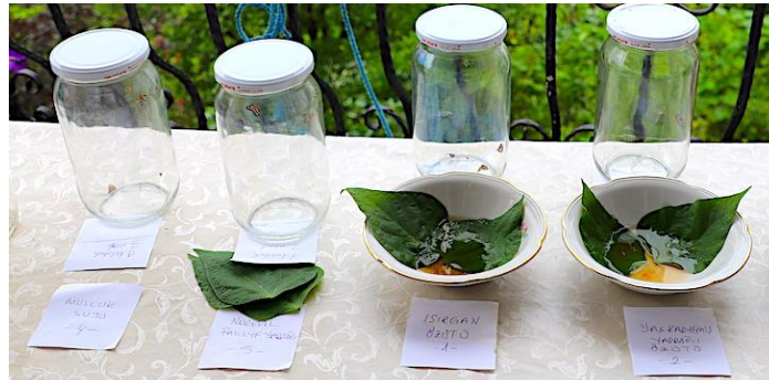
Şekil 7. Deney düzeneđi malzemeleri

Toplanan böcekler mümkün erişkin ve nimf gruplarına ayrıldı. Gruplar, kontrol 1, kontrol 2, karayemiŐ özütü ve ısırgan özütü uygulanmak üzere dört ayrı kavanoza yerleŐtirildi (Şekil 7).