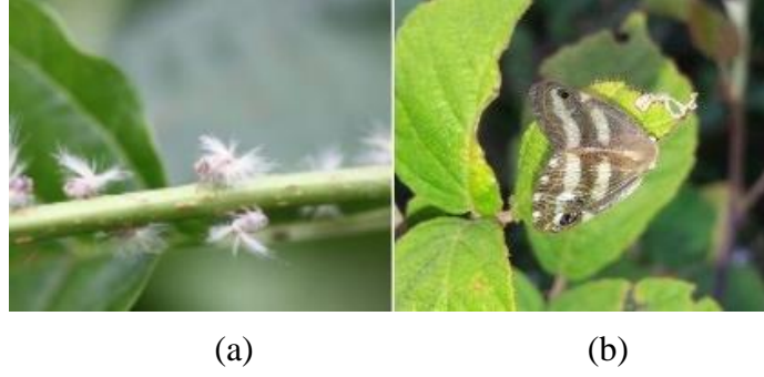
Şekil 2. Bitkiden beslenen nimfler (a) ve ergin bireyler (b)