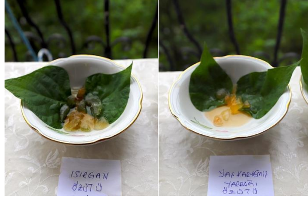
Şekil 5. Yapraklara özüt emdirilmesi