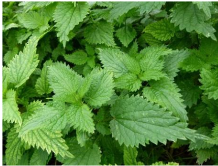
Şekil 3. Isırgan bitkisi

Isırgan yakıcı tüyleri ile insan derisini tahriş etmesiyle tanınan bir bitki türüdür. Taksonomide Rosales takımının Urticaceae familyasının Urtica cinsine aittir. Topladığımız bölgede yaygın bulunan türün latince adı Urtica dioica dır [4]. Isırgan otu tüketimi iltihap, ülser ve romatizmaya iyi gelir ve vücutta anti oksidan etki gösterir [15]. Bozsik 1996 yılında, ısırgan bitkisinin sulu özütünün tarım bitkileri üzerinden damarları emerek beslenen bir zararlı tür olan Cryptomyzus ribis üzerinde öldürücü etkisi olduğunu bildirmiştir [7]. Buradan yola çıkarak çalışmada ısırgan bitkisi (Şekil 3) kullanılmıştır.