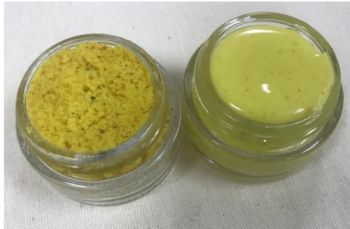
Şekil 1. Elde edilen krem karışımları (Sağdaki 1. Krem Karışımı, soldaki 2. Krem Karışımı)

Krem karışımları incelendiğinde 2. krem içeriğindeki 2 g kurkuminden dolayı daha katı bir karışım şeklinde olduğu görülmüştür. Şekil 1'de elde edilen iki karışımın son halleri görülmektedir.